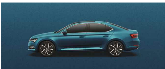
LAVA BLUE METĀLISKA