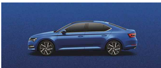
RACE BLUE METĀLISKA