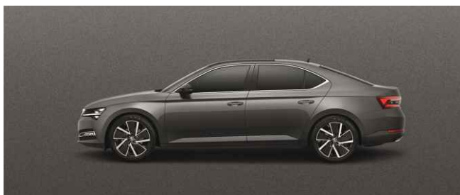
GRAPHITE GREY METĀLISKA