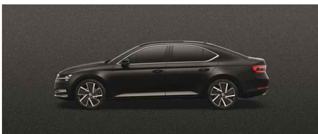
BLACK MAGIC METĀLISKA