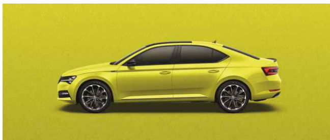
DRAGON SKIN METĀLISKA (Sportline)