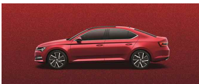
VELVET RED METĀLISKA