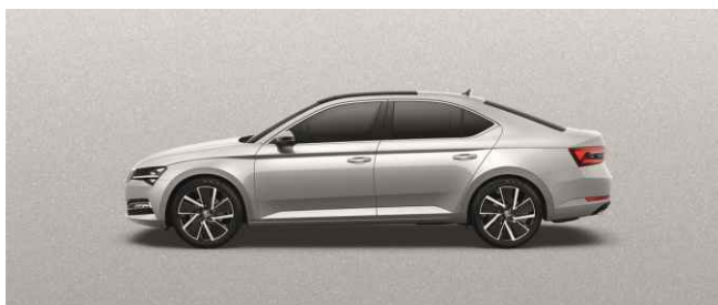
BRILLIANT SILVER METĀLISKA