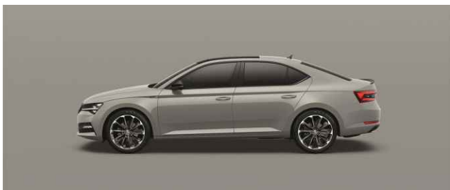
STEEL GREY METĀLISKA