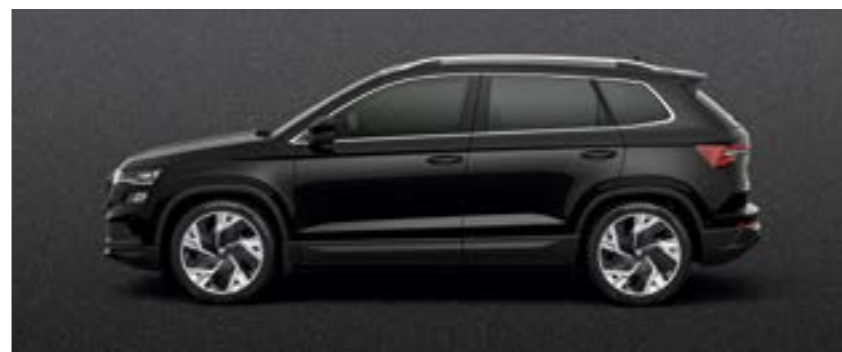
MAGIC BLACK METĀLIKA