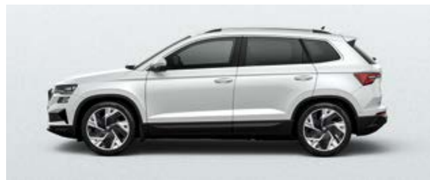
MOON WHITE METĀLIKA