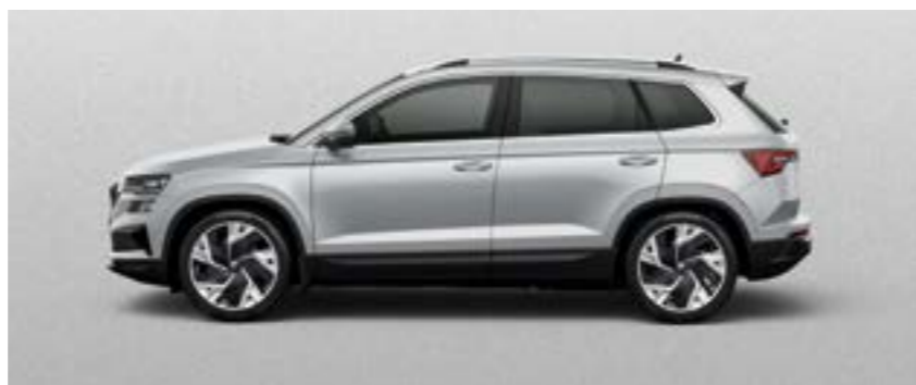
BRILLIANT SILVER METĀLIKA