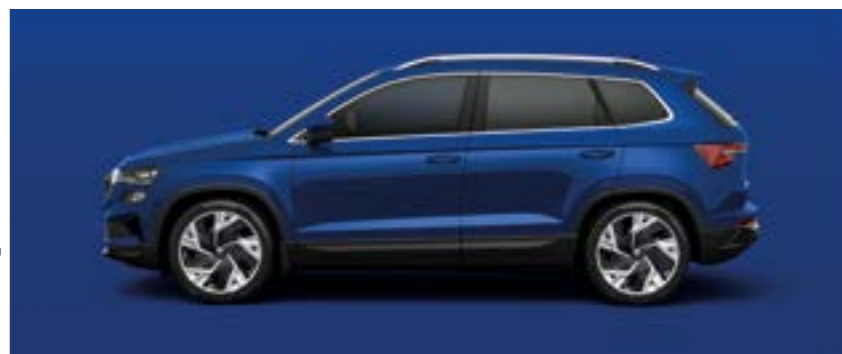
ENERGY BLUE UNI