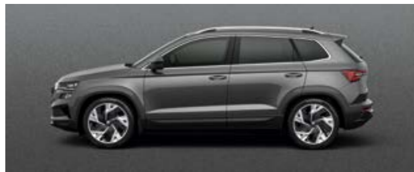
GRAPHITE GREY METĀLIKA