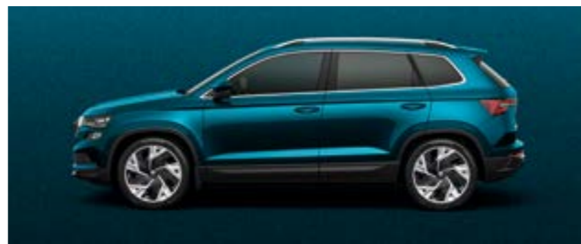
LAVA BLUE METĀLIKA