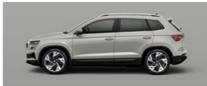
STEEL GREY UNI