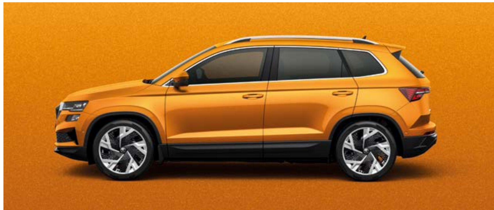
PHOENIX ORANGE METĀLIKA