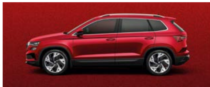
VELVET RED METĀLIKA