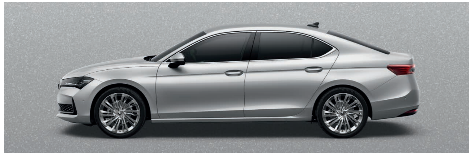
Pebble Silver metālika