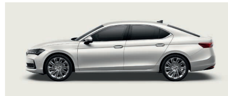
Purity White nemetālika