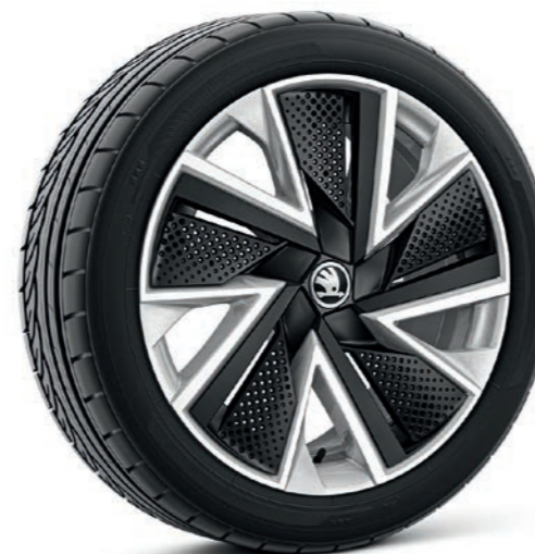
18" Bo sona sudraba krāsas vieglmetāla diskī ar melnām aero uzlikām