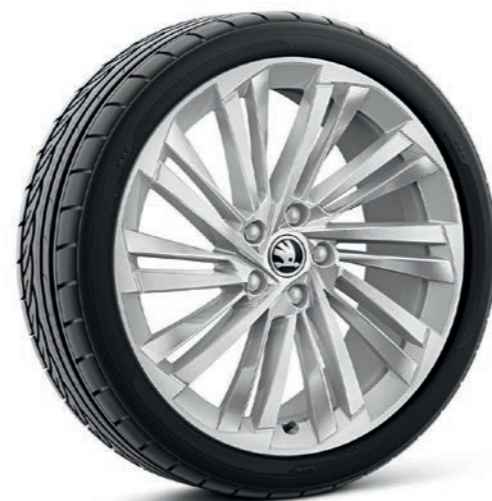
19" Veritate sudraba krāsas vieglmetāla diskī