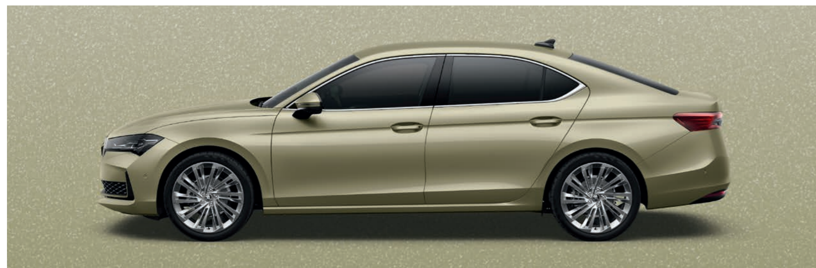
Ice Tea Yellow metālika