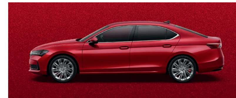
Carmine Red metālika