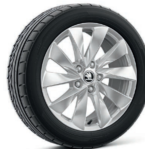
17" Mintaka sudraba krāsas vieglmetāla diskī