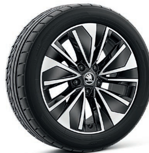
17" Alrakis melni / sudraba krāsas vieglmetāla diskī