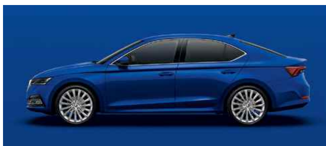
Nemetālistiska [krāsa] Energy Blue