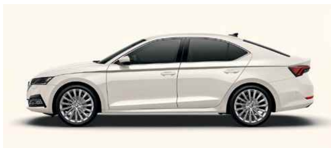
Nemetālistiska [krāsa] Candy White