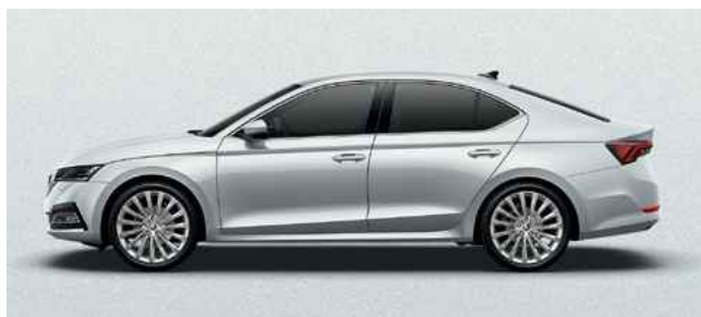
Metālistiska [krāsa] Moon White