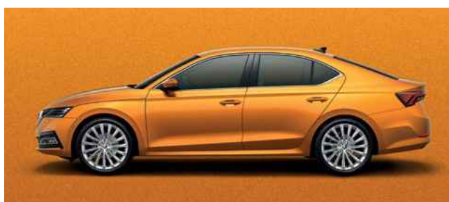
Metālistiska [krāsa] Phoenix Orange