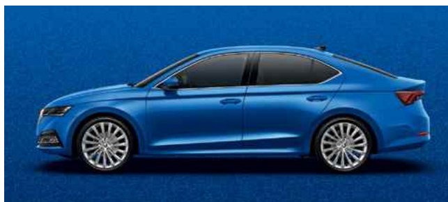
Metālistiska [krāsa] Race Blue