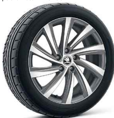
18 collu vieglmetāla diskī antracīta, pelēkā krāsā PERSEUS