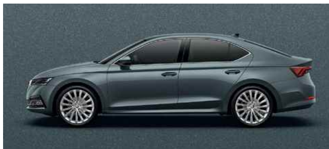
Metālistiska [krāsa] Quartz Grey