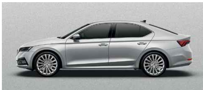
Metālistiska [krāsa] Brilliant Silver