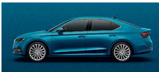
Metālistiska [krāsa] Lava Blue