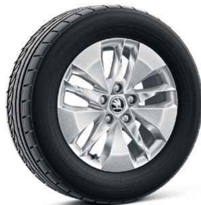
16 collu vieglmetāla diskī TWISTER Aero