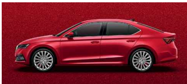
Metālistiska [krāsa] Velvet Red