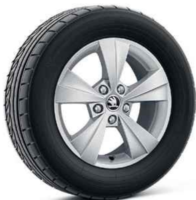
16 collu vieglmetāla diskī VELORUM