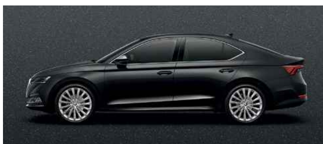
Metālistiska [krāsa] Magic Black