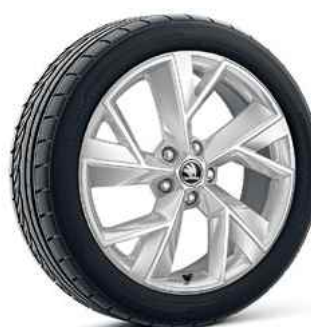
19" vieglme tāla diski TRIGLAV