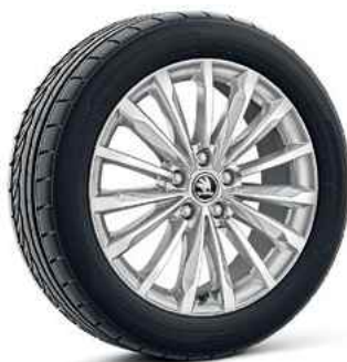
18" vieglme tāla diski TRINITY