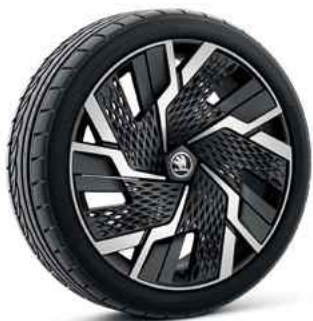
20" vieglmetāla disk SAGITARIUS ANTHRACITE ar AERO disku uzlikām