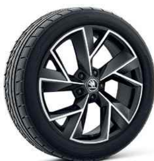
19" vieglme tāla diski TRIGLAV BLACK