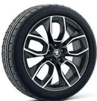
19" vieglme tāla diski CRATER melni