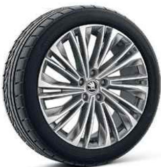
19" vieglme tāla diski CURSA ANTHRACIT