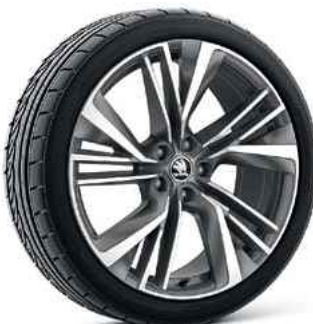
20" vieglmetāla disk IGNITE ANTHRACITE