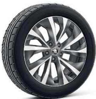
18" vieglme tāla diski ASKELLA