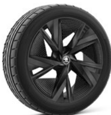
20" TAURUS BLACK AERO disku uzlikas