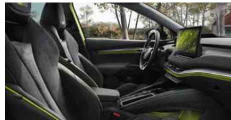
DIZAINA PAKETE "RS LOUNGE"