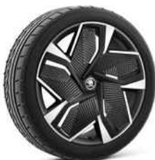
21" VISION AERO disku uzlikas 770 €