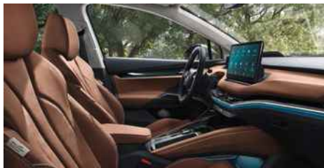
DIZAINA PAKETE "ECO SUITE"