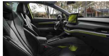
DIZAINA PAKETE "RS SUITE"