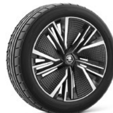
20" NEPTUNE 810€